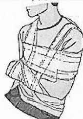
Аутоиммобилизация нижних конечностей. Фиксация поврежденной руки к телу